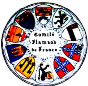
Comité Flamand de France