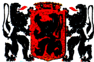
West – West 't huis best De Drie Koningen van Bruegeland